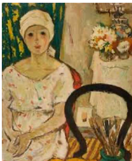
Nicolae Tonitza (1886-1940), Femeie în interior