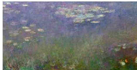
Claude Monet (1840-1926), Nuferi