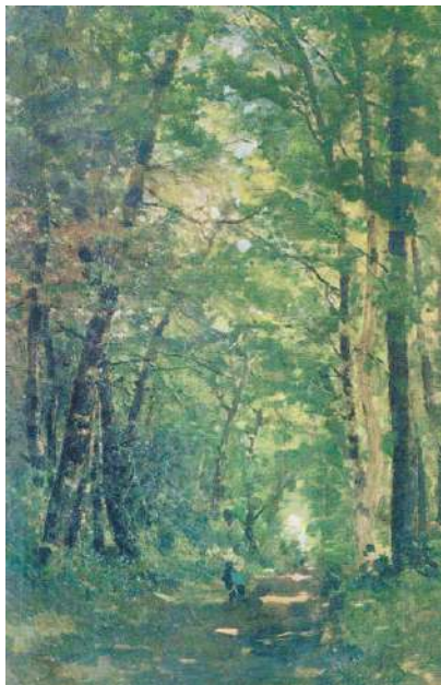
Nicolae Grigorescu (1838-1907), În pădure