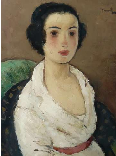
Nicolae Tonitza (1886-1940), Portret de tânără