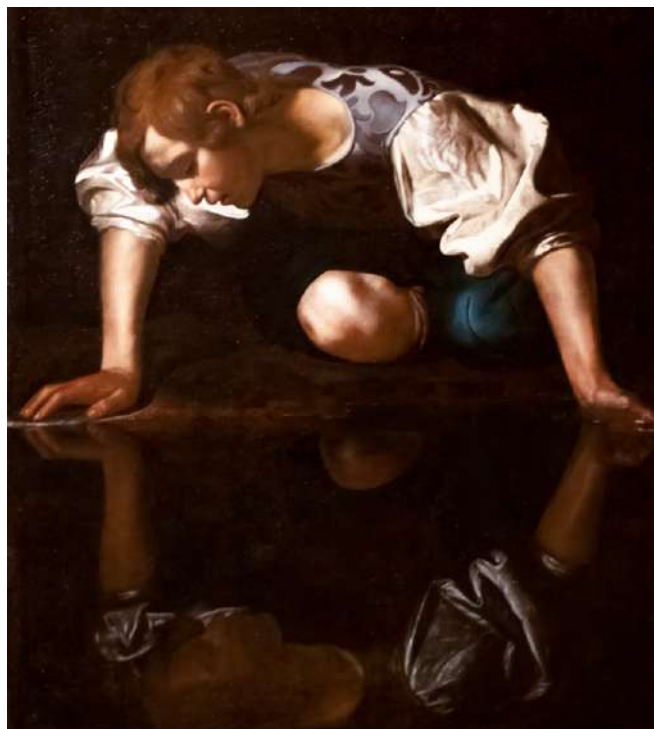
Michelangelo Merisi da Caravaggio (1571-1610), Narcis